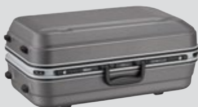
Valise CT-505 (incluse)