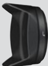
Parasoleil à baïonnette HB-75 (inclus)