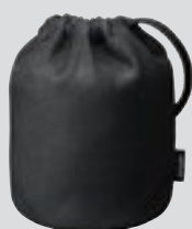
Pochette d'objectif CL-1218 (en option)